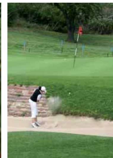
Ein „schottischer“ Grünbunker am 16. Grün

Mit je acht Spielerinnen im Team traten die sechs Mannschaften der 2. Jungseniorinnen-Liga zu ihrem zweiten Spieltag im Golfgarten Deutsche Weinstraße an.