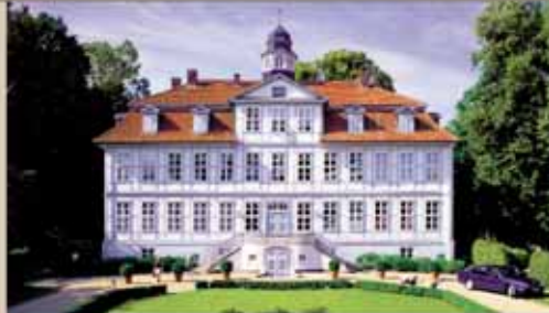
SCHLOSS LÜDERSBURG Schloss Lüdersburg bei Lüneburg (36 Loch, 44 Zimmer)

Mit maßgeschneiderten Angeboten, wie z.B. Unterstützung bei der Turnierorganisation und Handicap-Verwaltung, Rundenverpflegung und Vorschlägen für das Rahmenprogramm, präsentieren sich die FORE! Hotels auch als attraktive Reiseziele für kleinere und große Golf-Gruppen. In einigen der Häusern steht ein Sportdirektor oder eine Gästebetreuerin für alle Fragen und Wünsche rund ums Golfen zur Verfügung.