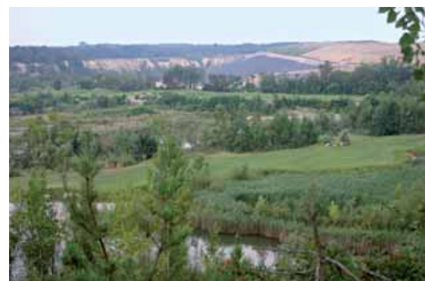
Im Hintergrund der bestehenden Golfbahnen links die Steilwand und rechts Mülldeponie und Hochebene

Den verwegenen auf der Höhe über der Steilwand angelegten Bahnen 2 und 3, folgen die in der Tiefe gestalteten Bahnen 4 bis 10, ehe sich die 11. Bahn auf das Plateau des Lennebergs hinauf schwingt. Dort stoßen die Fairways dann an den Ort Budenheim, wo sich der Sitz des Architekten, Hauptinitiators und Anteilseigners Udo Ries befindet. Unermüdlich hat sich dieser an unzähligen