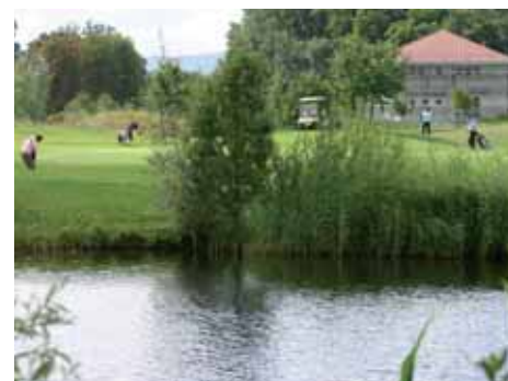
Teich und 18. Grün vor dem Neubau des Funktionsgebäudes am Clubhaus