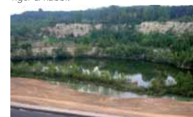
Felswand hinten und Spielbahn 5 auf dem Bruchgrund

Lenneberg GmbH & Co. KG nicht dupieren und die gewünschten Termine sicher einhalten. Das verschiedenartige Golfgelände mit Tiefzone und Spiel-Plateaus beinhaltet die Golfsport- und Landschafts-Elemente ebenso, wie die nach § 24 LPFLG geschützten Biotop. Diese setzen sich zusammen aus Steilwand in Verbindung mit Sandrasen, Felslandschaft, Saumgesellschaft wärmtrockener Standorte mit Sandrasen und Röhrich.