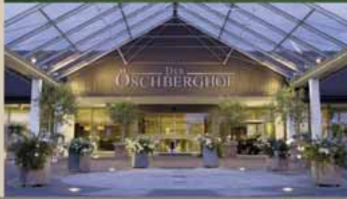
Der ÖSCHBERGHOF Öschberghof in Donaueschingen (18 Loch, 73 Zimmer)