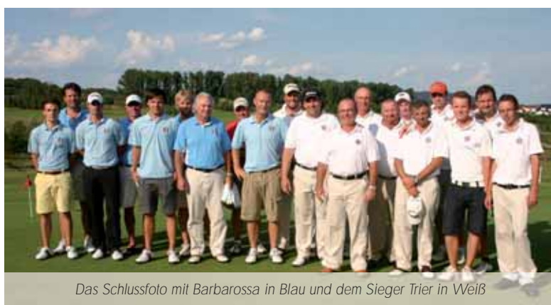
Das Schlussfoto mit Barbarossa in Blau und dem Sieger Trier in Weiß