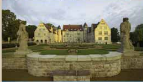
SCHLOSSHOTEL MÜNCHHAUSEN Schlosshotel Münchhausen bei Hameln im Weserbergland (36 Loch, 66 Zimmer)