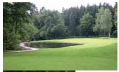
Blick auf die 17. Spielbahn

Das Platzrichter-Team mit Dörte Weiher und Eberhard Schuld hatte den Platz am Vortag bestens vermessen und mit großer Übersicht den Wettbewerb der jungen Cracks famos über die Bühne gebracht.