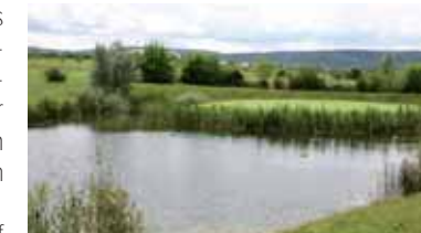
Teich und Bunker am 17. Grün