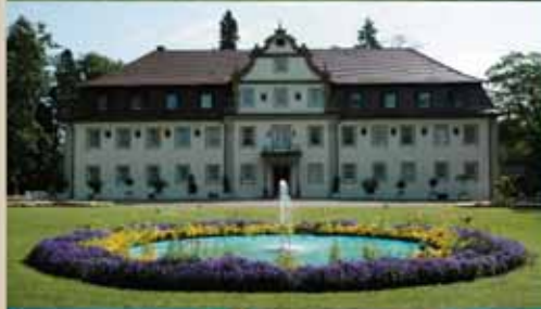
Wald & Schlosshotel Friedrichsruhe Wald & Schlosshotel Friedrichsruhe bei Nürnberg (18 Loch, 39 Zimmer)