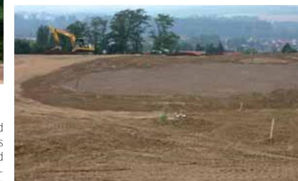
Der Unterbau eines Grüns ist fertiggestellt

Flaggenparade an der Einfahrt zum Mainzer Golfclub