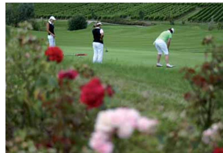
Inmitten von Weinbergen und Rosen putten die Jungseniorinnen auf dem 9. Grün