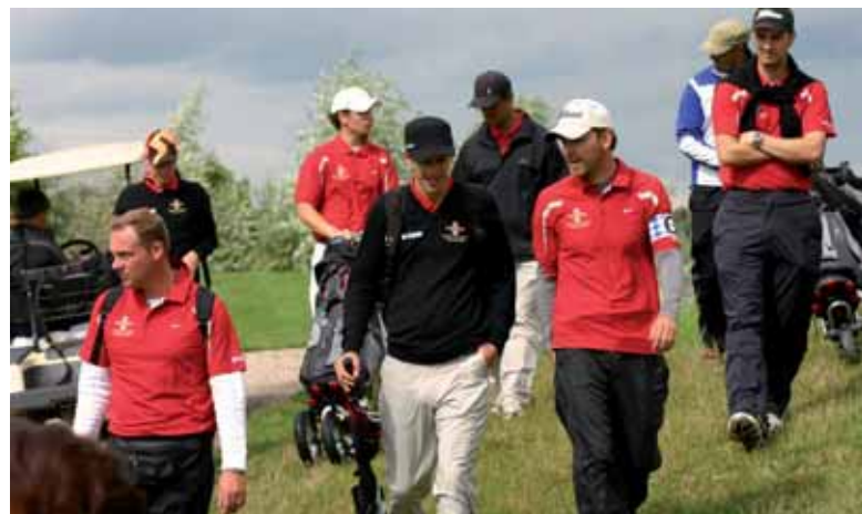
Einige Spieler des GC Kiawah haben ihre Spiele beendet

Auch von den gelben Abschlügen bei 6052m Länge, bietet der Golfcourse am Dreihof in Essingen bei Landau an der Südlichen Weinstraße, noch ausreichend Schwierigkeiten, die von den Spielern tunlichst umgangen werden sollten. Sechs Achter-Teams waren zu den Aufstiegsspielen angereist, welche ihre Halbfinals in der Landesliga und Oberliga Mitte 1 an den Spieltagen 1 und 2 siegreich beendet hatten.