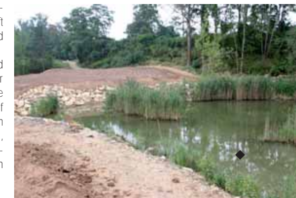
Biotop vor dem neuen 5. Grün