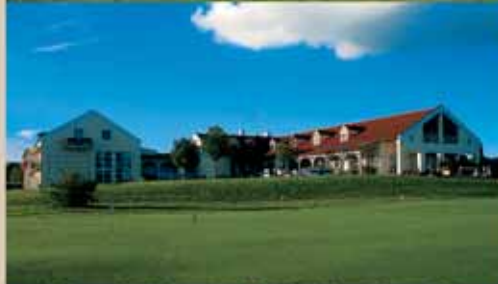
Gutshof Sagmühle in Bad Griesbach (18 Loch, 22 Zimmer)