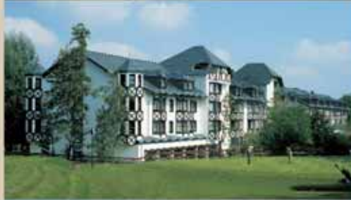
LAND & GOLF HOTEL STROMBERG das besondere Resort Hotel ***** SUPERIOR Land & Golf Hotel Stromberg bei Mainz (18 Loch, 184 Zimmer)